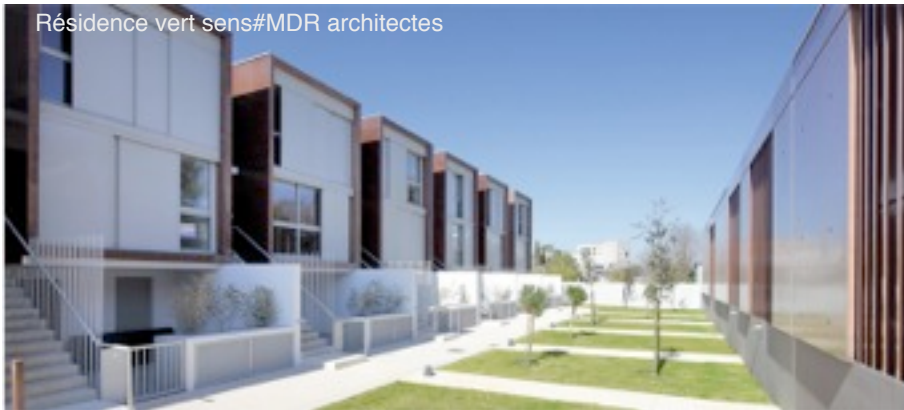
Résidence vert sens#MDR architectes