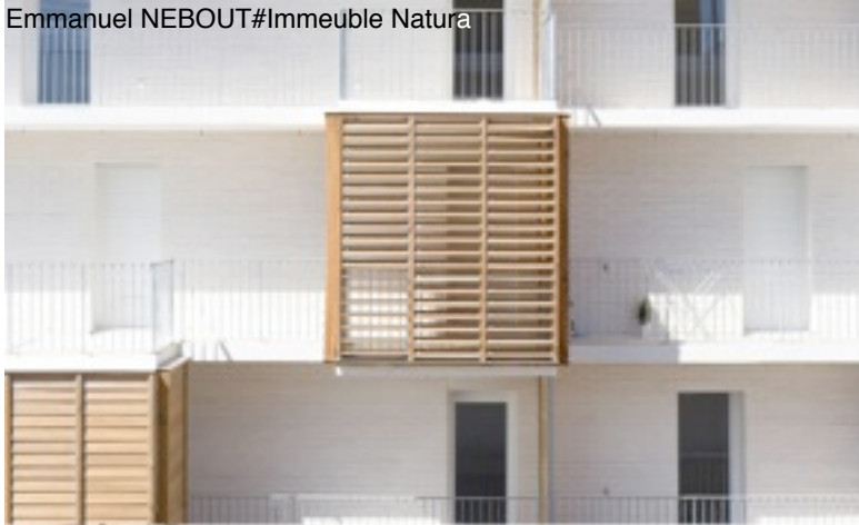
Emmanuel NEBOUT#Immeuble Natura